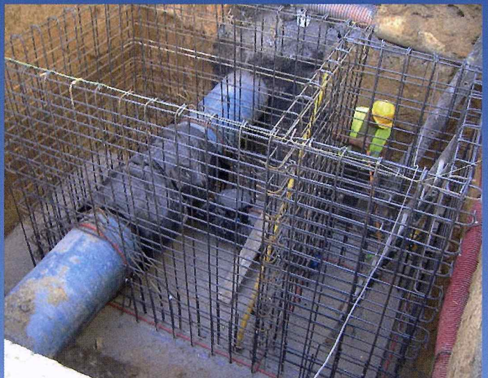
INSTALACIÓN ARQUETA DE DESAGÜE