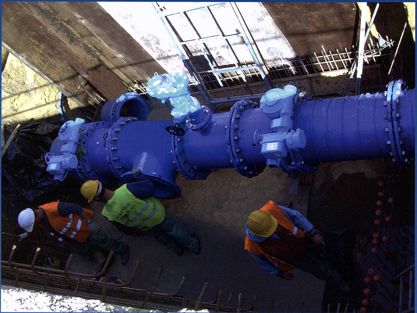
INSTALACIÓN ARQUETA DE CONEXIÓN EN CALLE JUAN SEBASTIÁN EL CANO