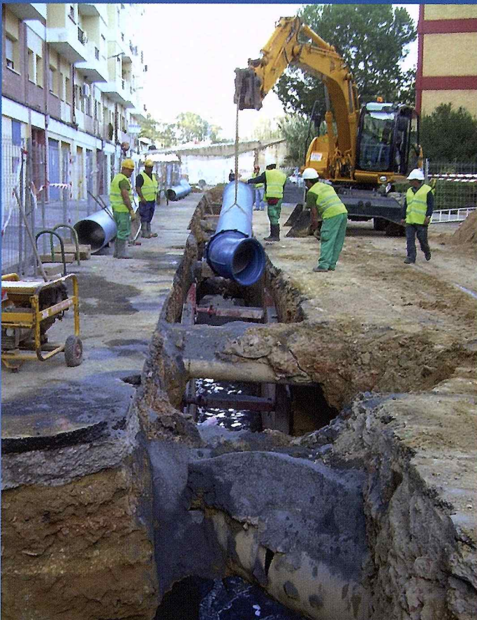
INSTALACIÓN CODO 45° Y TUBO EN C/ MARQUÉS DE DOS FUENTES