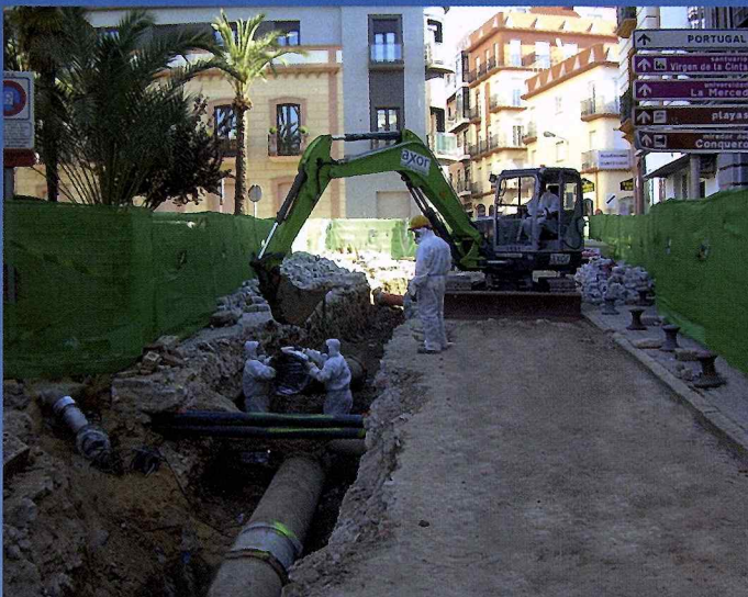
DESMONTAJE TUBO DE FIBROCEMENTO EN C/ LA FUENTE